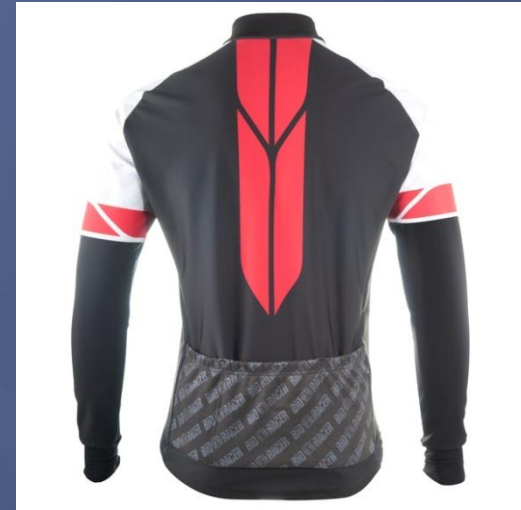
CHAQUETA WINDBLOCK WINTER PIXEL