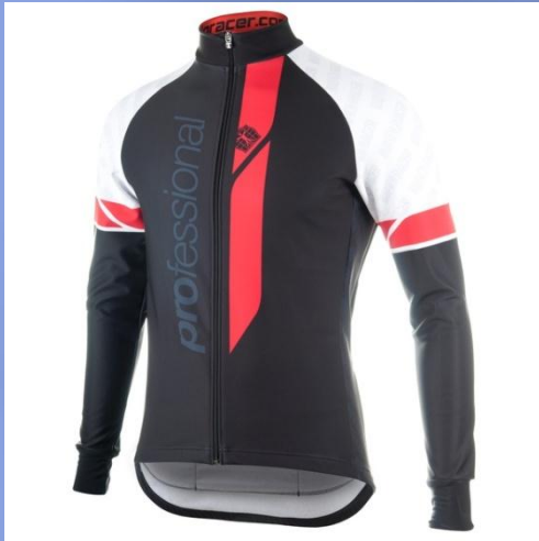
CHAQUETA WINDBLOCK WINTER